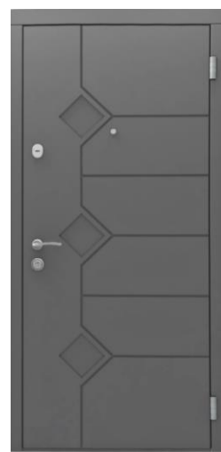
Модель - 01470