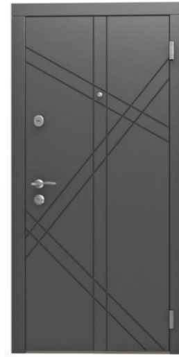
Модель - 01466