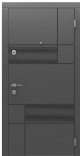
Модель - 01457