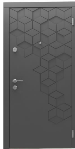
Модель - 01460