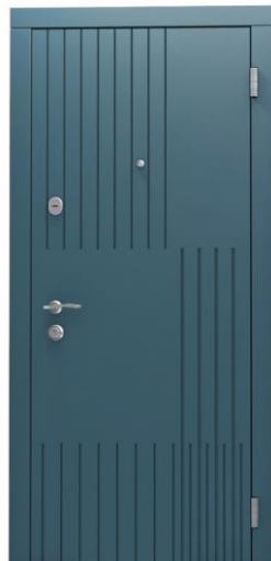
Модель - 01451