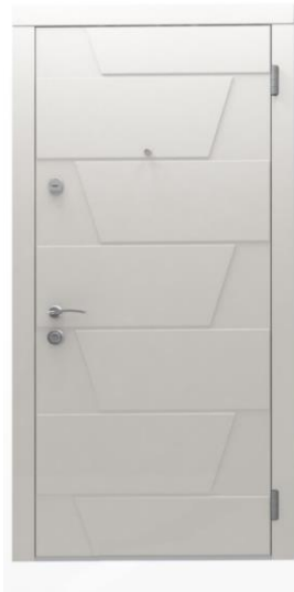
Модель - 01464