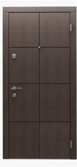
Модель - 01463