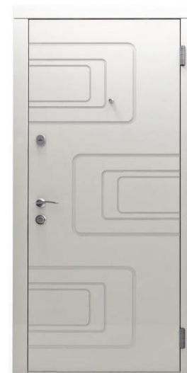
Модель - 01456