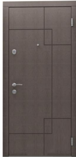
Модель - 01465