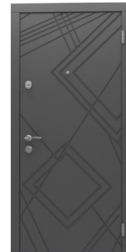
Модель - 01472