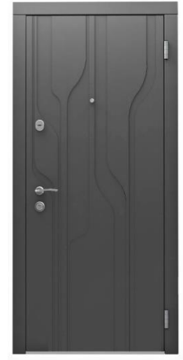
Модель - 01468