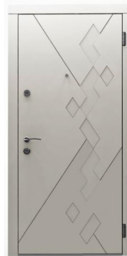
Модель - 01461