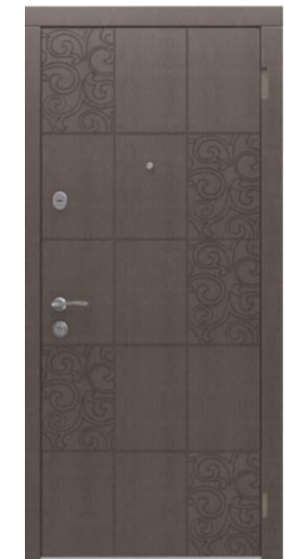
Модель - 01473