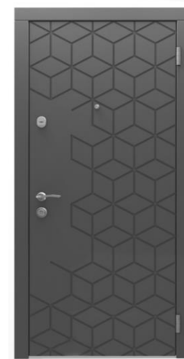
Модель - 01462