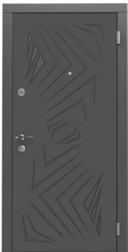
Модель - 01450