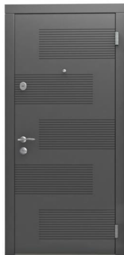
Модель - 01458