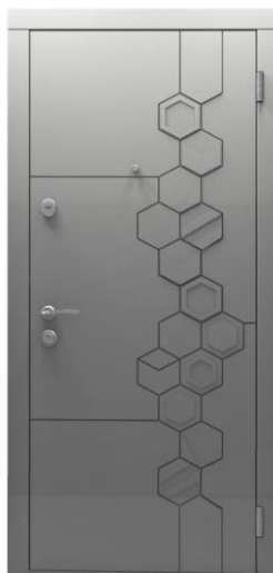
Модель - 01459