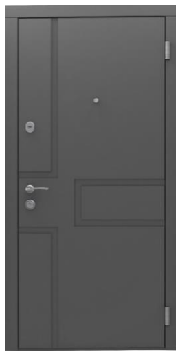
Модель - 01469