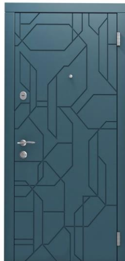
Модель - 01453