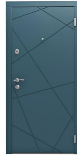
Модель - 01467