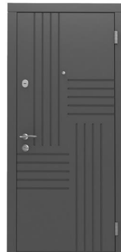
Модель - 01454